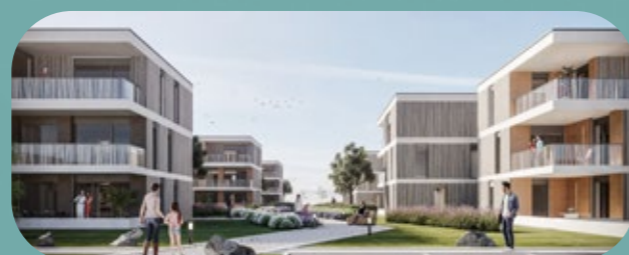
2019 — Les Jardins d'Orane