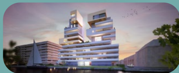
2020 — L'Almleggo