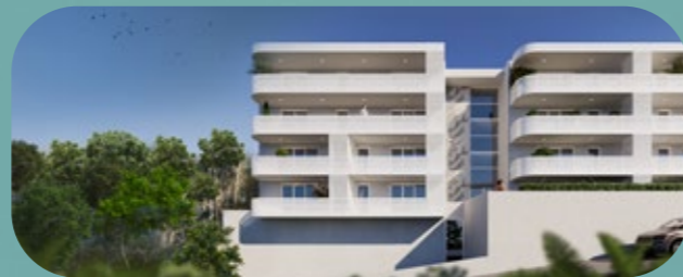
2021 — La Réserve